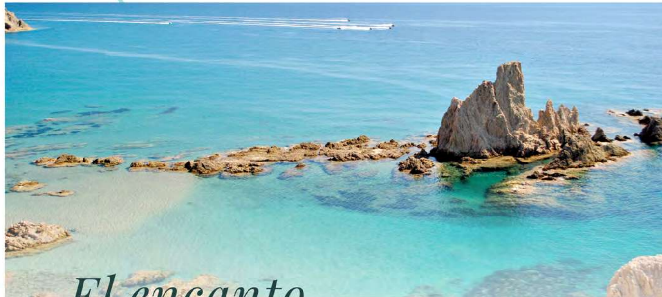
El encanto del Cabo